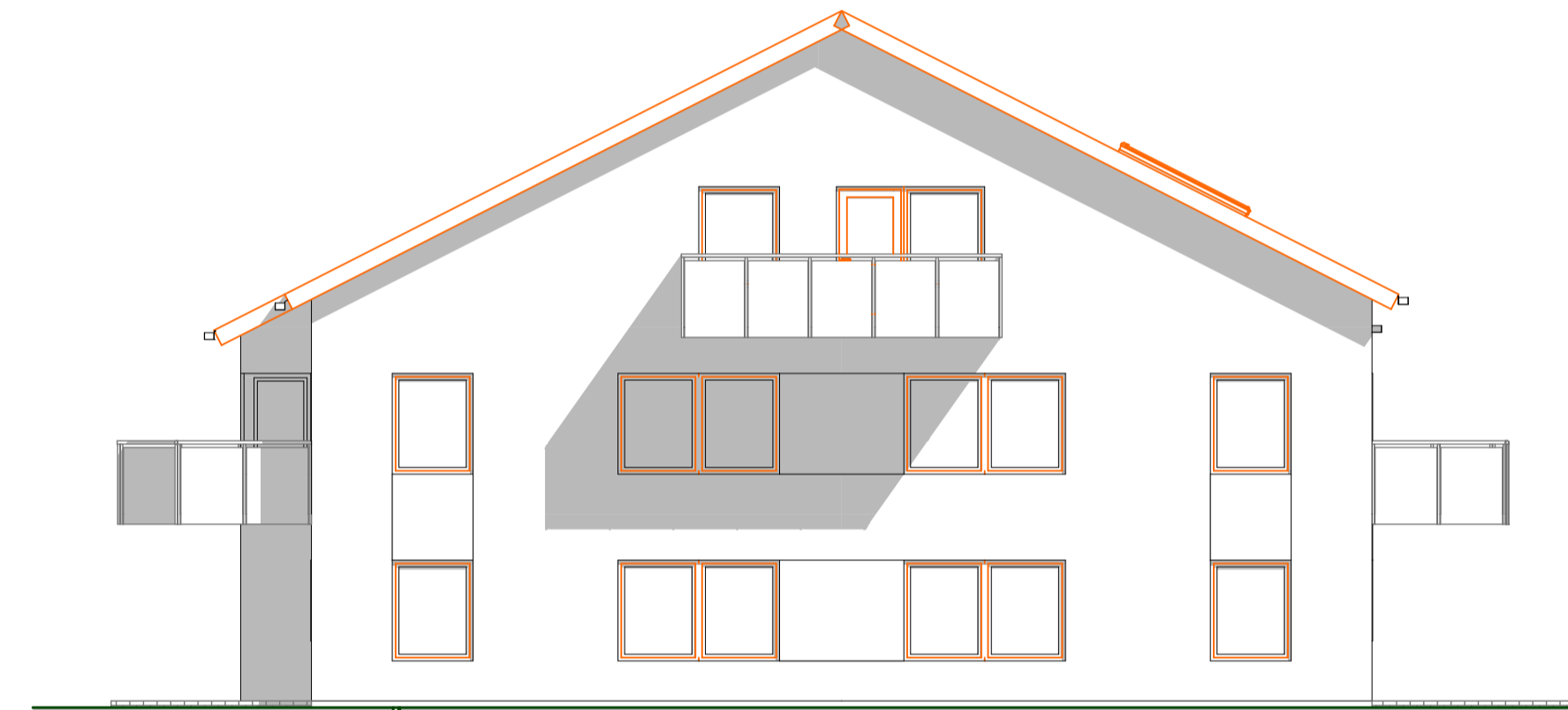
Fasad A5 1:100